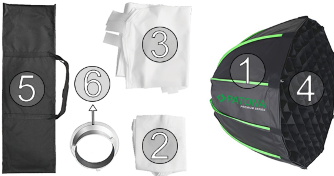
Diagramma del prodotto