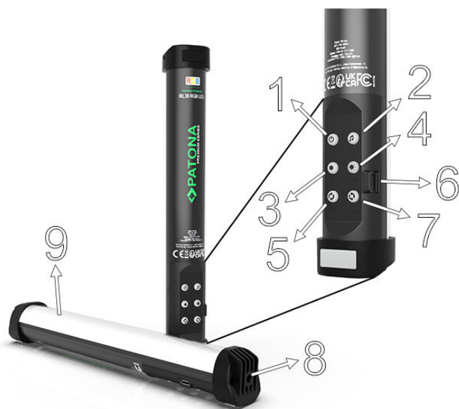
Diagramma del prodotto